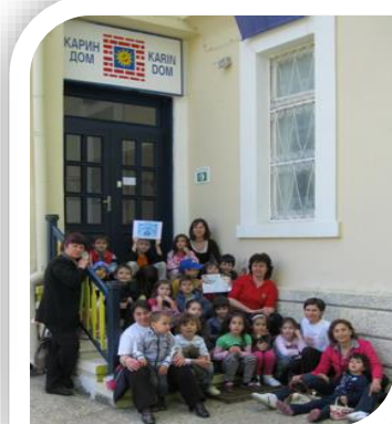
Партньорство с Карин дом