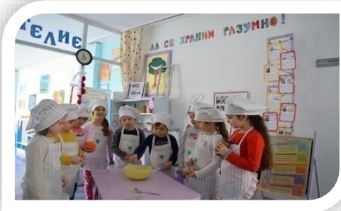
Пилотна детска градина по международен проект « Да се храним разумно »